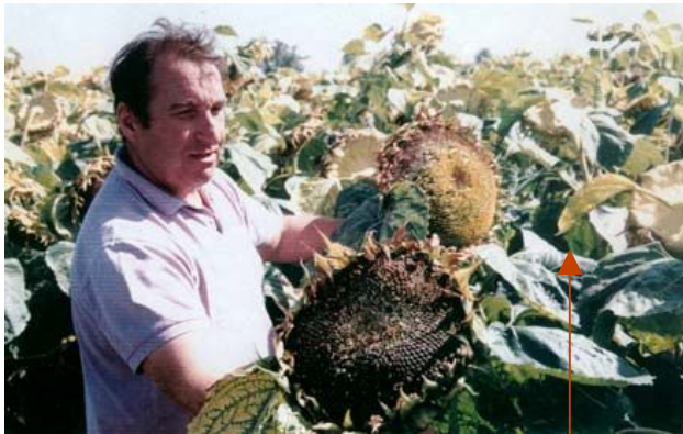
Capitule en pleine maturité