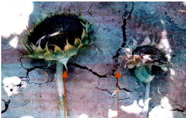
Avec Polyter Sans Polyter Tournesols sans apport d'irrigation