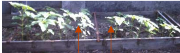
Avec Polyter Sans Polyter Tournesols le 30 août 2002