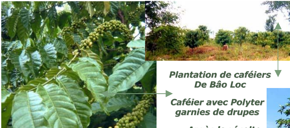
Plantation de caféiers De Bão Loc

Des tests en 2003 ont été menés dans une station agricole de la région de Bão Loc à 150 Km de Ho Chi Minh Ville, à une altitude d'environ 1000 m. Dans cette zone se concentre également des plantations de Thé, de Poivre, de Tabac et de Canne à Sucre.