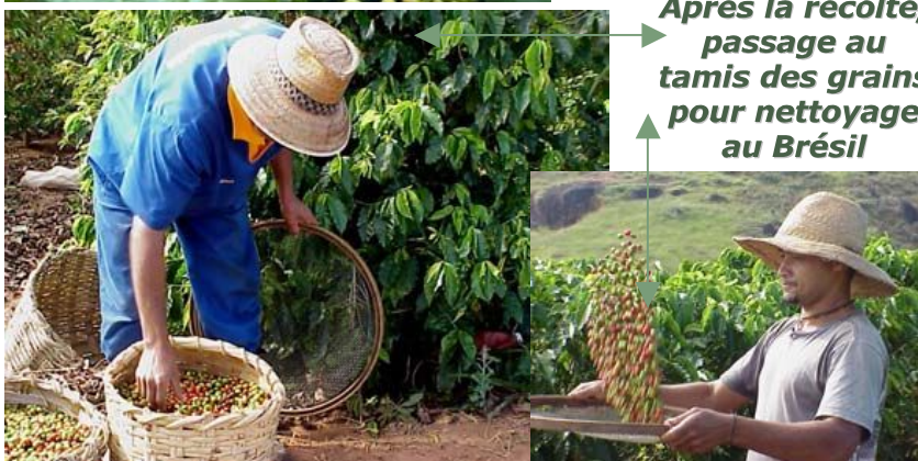
Après la récolte, passage au tamis des grains pour nettoyage au Brésil